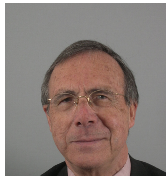
Laurens Jan Brinkhorst Coordinatore Europeo

La presente relazione rappresenta esclusivamente l'opinione del coordinatore europeo e non pregiudica la posizione ufficiale della Commissione europea.