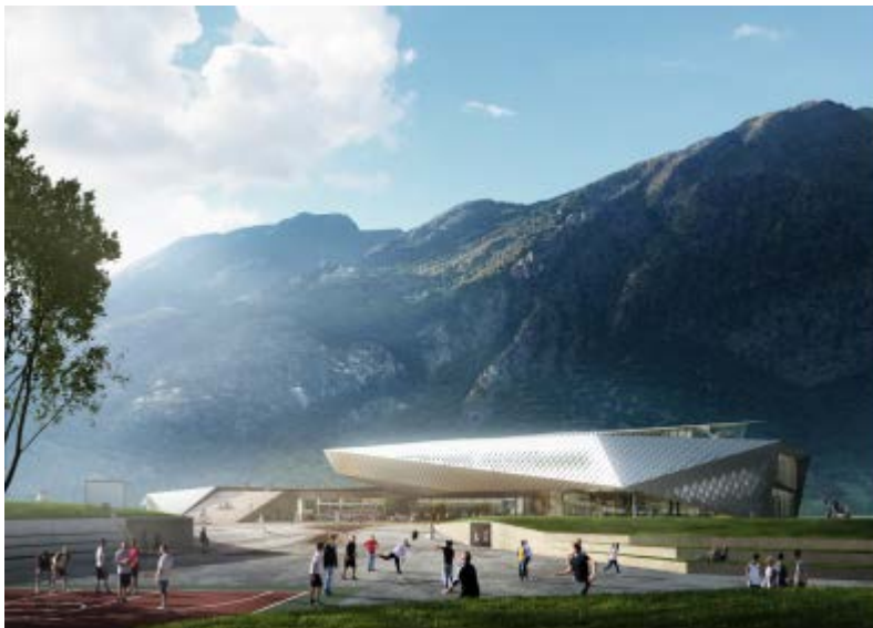
La futura stazione internazionale a Susa

A Chiomonte si trova il pozzo discendente italiano, che costituirà uno dei quattro punti di accesso della galleria di base del Brennero per la sicurezza e il soccorso (gli altri tre sono in Francia).